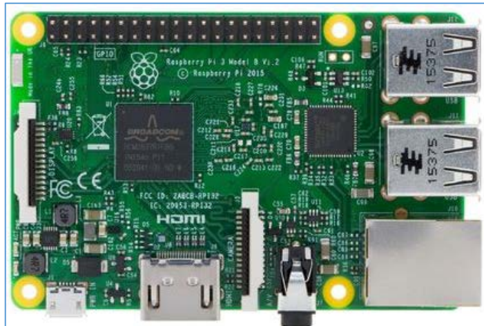
Raspberry Pi op ongeveer ware grootte

Bij bepaalde modellen zijn er mogelijk nog wat verschillen. Zo heeft de versie 3 ook een wifi antenne.